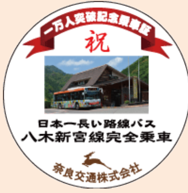
▲贈呈品デザイン（表）