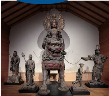
安倍文殊院・渡海文殊群像