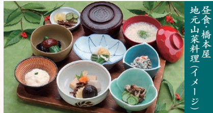
昼食・橋本屋 地元山菜料理(イメージ)