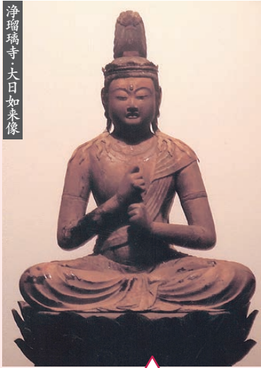
浄瑠璃寺・大日如来像