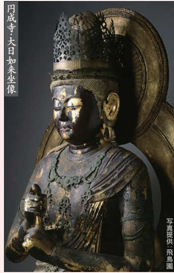
円成寺・大日如来坐像