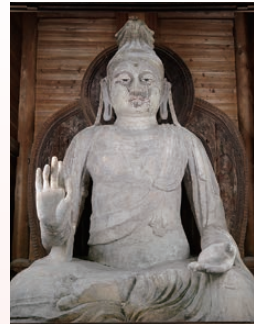
岡寺・如意輪観音座像